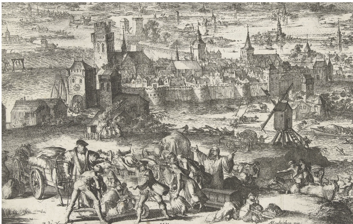
Een dramatische uitbeelding van de ramp (detail boven) is van de hand van Romeyn de Hooge (1645-1708), vervaardigd omstreeks 1675 naar een schilderij van Arnold Houbraken.

De belangrijkste oorzaak van de overstroming was de verwaarlozing van de dijken, die niet bestand waren tegen de hoge waterstanden tijdens de novemberstormen. De stormvloed van 1421, waarbij de dijk doorbrak bij Wioldrecht en in december nog een doorbraak volgde bij Werkendam, zette de gehele Grote Waard, een gebied van 40 à 50.000 hectare land, onder water. Volgens overlevering zouden 72 dorpen door de vloed zijn getroffen. In de loop van de geschiedenis hebben heel wat kunstenaars de desastreuze overstroming uitgebeeld.