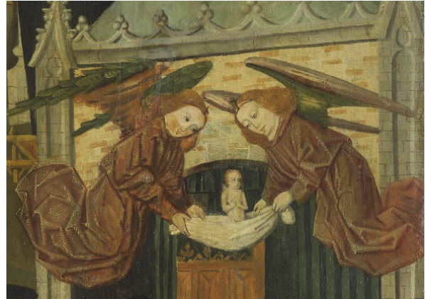
Links: het sterfbed van Elisabeth in aanwezigheid van een lezende non en haar biechtvader Koenraad. Boven nemen twee engelen haar ziel, in de vorm van een klein figuurtje, mee naar de hemel.

Onder grote belangstelling werd het lichaam van Elisabeth door Franciscaner monniken begraven in de kapel van het hospitaal (rechts).