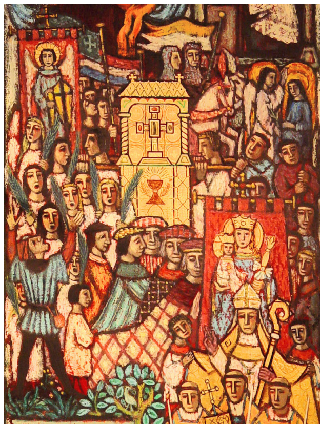
De processie van het Heilig Hout of Kleine Ommegang. Detail van de altaarschildering door Toon Winkel (1954).

Geen dag werd, gedurende de XVe en XVle eeuw, statiger door Dordrechts ingezetenen gevierd, dan die, welke aan de apostelen Petrus en Paulus was toegeheilgd. Dan stroomde, reeds bij het aanbrenken van den dageraad, eene talrijke schaar uit de naburige plaatsen, naar de H. Kruis Kapel ter Grooter Kercke, om, met de feestelijk uitgedoste stedelingen, de misse van den H. Sacramente en van den H. Houte te hooren, met de scoolkijnders, door den coster tot maeghden en engelen toebereid gemaect, en in haer ordinantie gestelt, den loff van het H. Kruis te zingen, en den triumphanten omganc van 't H. Hout te volgen.