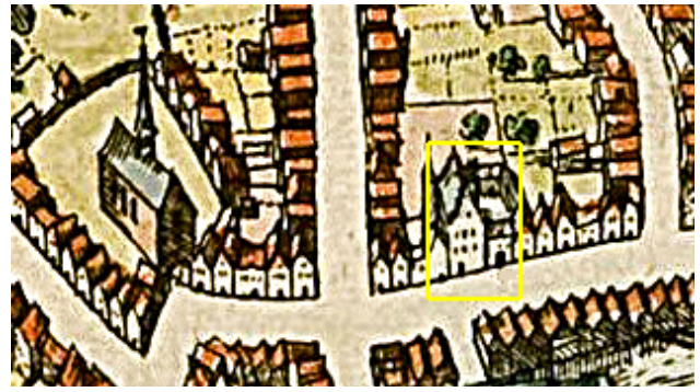
Mijnsherenherberg (binnen gele rechthoek) aan de Voorstraat. Links de kerk van het augustijnenklooster.

De proef vond plaatst in Mijnsherenherberg aan de Voorstraat. Hier logeerden de graven van Holland als zij de stad bezochten.