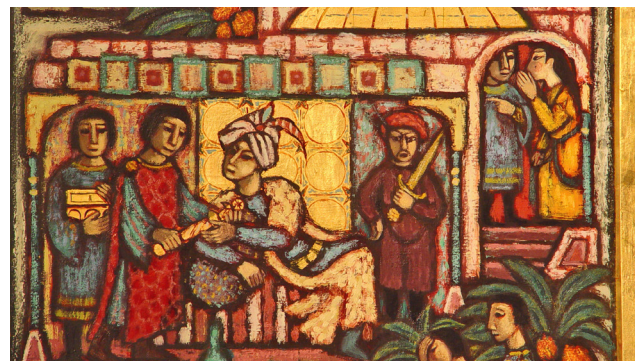
De sultan verruilt de scepter voor de fraaie juwelen. Detail van de altaarschildering door Toon Winkel (1954).

Bij het zien van de prachtige juwelen werd de hebzucht van de vrouwen opgewekt en beraamden zij een list om in het bezit te komen van de juwelen. In het geheim deelde de dochter aan Claes mee, dat de edelstenen op de scepter van haar vader gevat waren in een stuk hout van het kruis van de god van de christenen. Haar vader wist ze te overtuigen, door te zeggen dat de scepter toch wel plomp was en hij deze beter kon verruilen tegen de prachtige juwelen van de koopman. Aldus geschiedde.