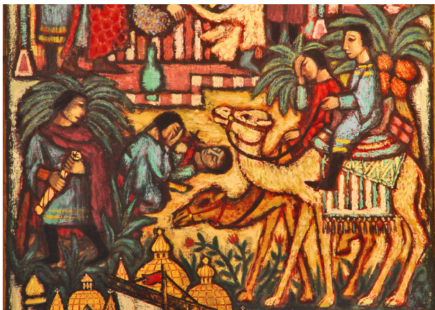
De koopman wordt ernstig ziek en sterft in de woestijn. Detail van de altaarschildering door Toon Winkel (1954).

Claes, die zich nu waarschijnlijk niet veilig meer voelde, ontdeed de scepter van de edelstenen. Het kruishout brak hij in delen en verborg deze in zijn kleding.