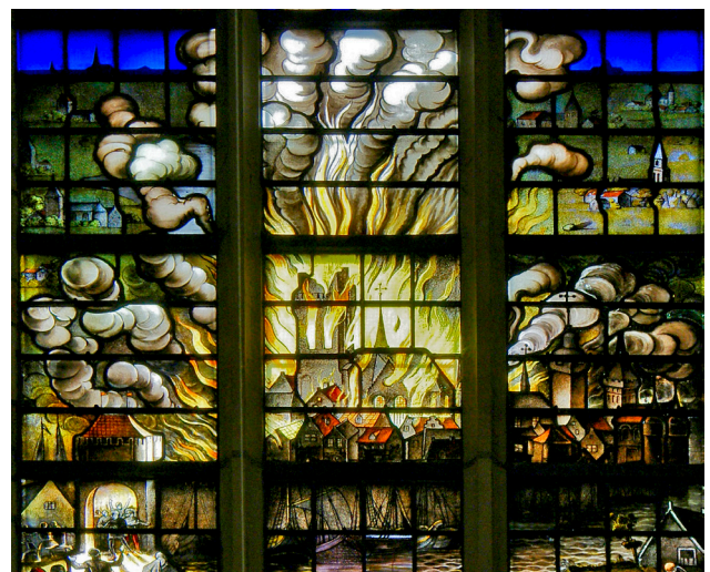
De brand van de Grote Kerk in 1457, afgebeeld op een raam in de Jeruzalemkapel in de Grote Kerk.

Op 28 juni 1457 brak er in de stad brand uit die de vele houten huizen met de grond gelijk maakte. De brand ontstond in de Kleine Spuistraat en breidde zich met grote snelheid uit.