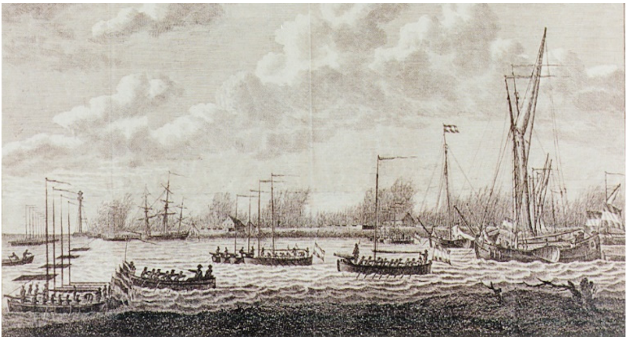
Kanonner-chaloupen en andere vaartuigen sluiten de Dordtse Kil af.

5 maart 1793 vertrok erfprins Willem Frederik van Oranje-Nassau met vice-admiraal van Kinsbergen en de Hertog van York, bevelvoerder van de te hulp geroepen Engelsen, voor inspectie langs de Merwede, het Eiland van Dordrecht en plaatsen waarvan men verwachtte dat de vijand het land zou kunnen binnenvallen.