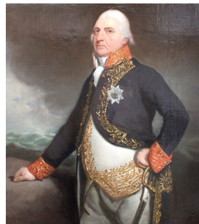
Vice-admiraal van Kinsbergen.