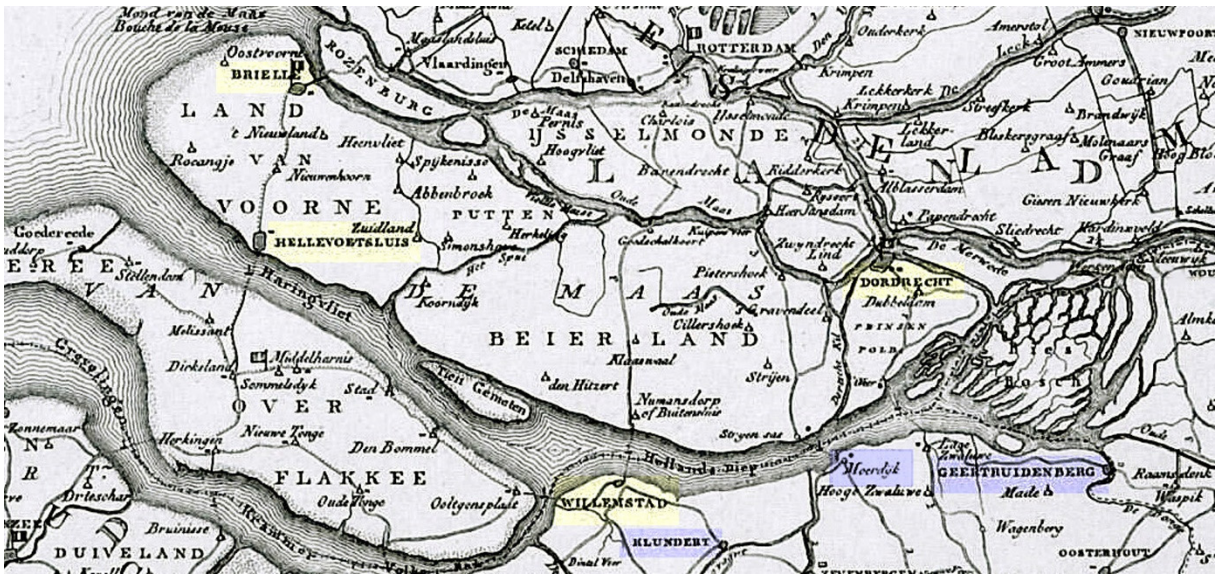
De plaatsen in het blauwe vlak waren bezet door de Fransen.

Briel. Vijf compagnieën verbleven in Hellevoetsluis. 5 maart, bij het aanbreken van de dag, scheepten de overige militairen zich in smalle vaartuigen in voor vertrek naar Dordrecht, de stad waar zij zouden worden ondergebracht.