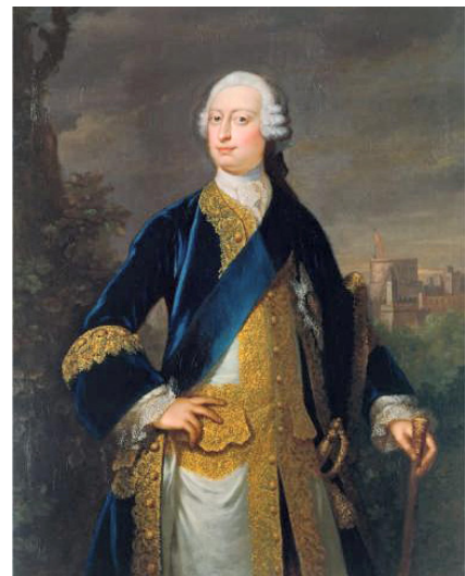
Prins Frederik, Hertog van York

Al op 25 februari verzamelden zich drie regimenten Infanterie (circa 3.000 militairen) in het St. Jamespark bij het Buckinghampalace in Londen voor een parade in tegenwoordigheid van de koninklijke familie. Vervolgens marcheerde het leger naar Greenwich waar werd ingescheept; ook hier was de koninklijke familie aanwezig.