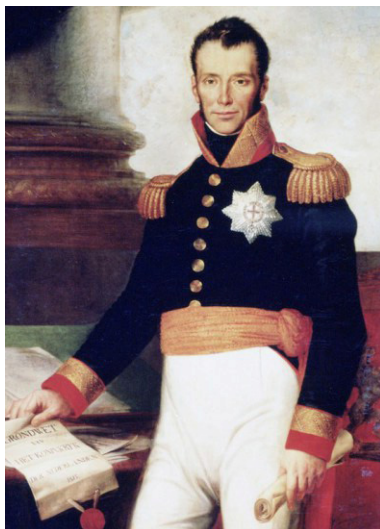
Erfprins Willem Frederik