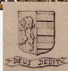
Deus Dedit (God heeft gegeven).

Het koperen koorhek werd in 1744 voltooid en is vervaardigd in de stijl van die dagen, het rococo. Het koperen hekwerk rust op een geaderd marmeren borstwering met ornamenten. Tussen twee pijlers van wit marmer en roodgeaderd marmer in de vorm van een obelisk ( tapstoelopende pijler ) bevinden zich de koperen toegangsdeuren naar het Hoogkoor. De stijl boven de deuren draagt het wapen van Diodati.