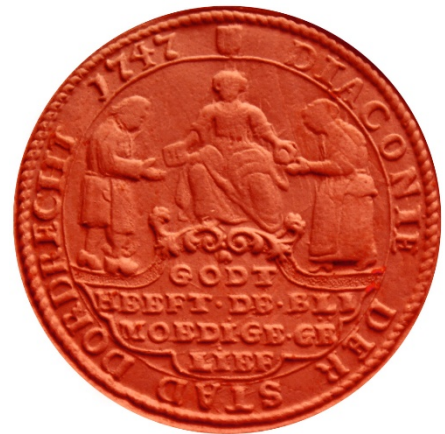
Diaconiezegel van de stad Dordrecht

Aan vier en twintig dragers die er sullen moeten versogt worden om mij te dragen ieder vijftien enkele gouden Ducaten eens, sonder meer, die in ’t sterfhuijs, nadat sij mij ten grave sullen hebben gebragt in plaatse van een tractement, ’t geen ik niet versta dat gegeven wordt, sullen moeten affgelangt (= uitgereikt) worden.